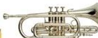
CORNETS À PISTONS