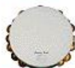
TAMBOURS SUR CADRE